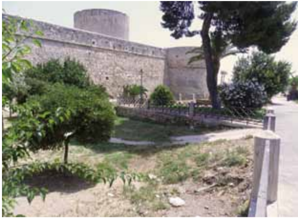
Il fossato del Castello di Manfredonia

Finalmente svelato l'arcano! Il fossato del Castello non è di proprietà della soprintendenza archeologica - così come molti pensano - ma del Comune. Infatti quando nel 1968, con D.P.R. del 21 giugno n. 952, il Castello fu nuovamente donato allo Stato dal comune manfredoniano, il fossato restò in possesso di quest'ultimo che avrebbe dovuto detenerne la sua conservazione e manutenzione. Cosa che, a dire il vero, in tutti questi anni è stata fatta