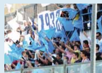
I tifosi del Manfredonia calcio