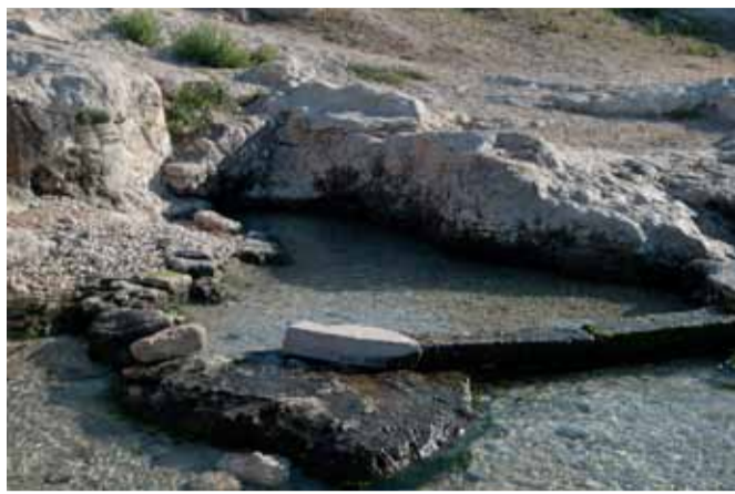
La sorgente "Acqua di Cristo"

Manfredonia, situata ai piedi del Gargano, risente del fenomeno del carsismo, principale caratteristica del promontorio. Tale fenomeno fa sì che la maggior parte delle acque piovane venga filtrata nei terreni ed arrivi sotto terra alimentando le falde acquifere per poi ritornare in superficie saltuariamente attraverso le sorgenti. Le zone dove queste sono diffuse sono le sponde sud-