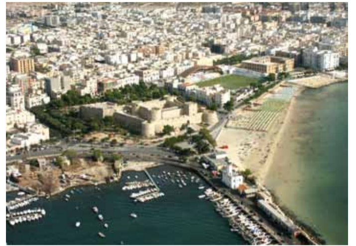
Veduta aerea di Manfredonia