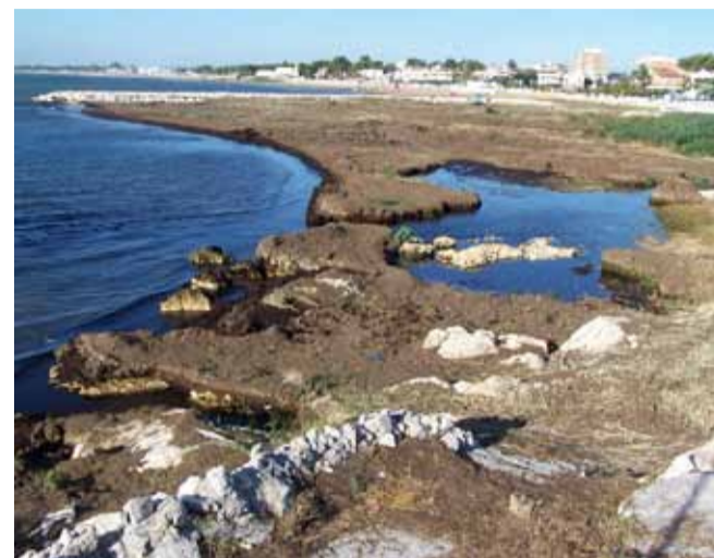
L'accumulo di posidonia sul litorale di Siponto.

spiaggiato che sarà stoccato a 4,4 chilometri di distanza nei pressi della foce del fiume Candelaro in un sito che diventerà area sperimentale di quest'alga che invade molte spiagge italiane. Parte di questa Cymodocea sarà utilizzata per ricomporre le dune di Siponto e la restante parte sarà reimpiegata in agricoltura dopo alcuni trattamenti. Per due anni la società Eco-logica Srl di Bari, che è stata incaricata dalla nostra amministrazione di progettare l'intera operazione, effettuerà monitoraggi sull'area in cui avverrà lo stoccaggio e sull'evoluzione del sistema dunale creato con questi residui spiaggiati. Il nostro Comune ha avviato dei progetti ambiziosi proprio sul compostaggio e se si riuscisse sarebbero degli importanti progetti pilota. L'operazione costerà al nostro comune circa 80 mila euro per la progettazione, la realizzazione di uno stoccaggio provvisorio, sistemi di sicurezza e operazioni di trasferimento in discarica e in area di stoccaggio. E questo è quello che proprio non ci va giù. È chiaro che è una situazione che è stata causata da un errore progettuale di quelle barriere pietrose che avrebbero dovuto portare benefici e non disguidi alla nostra costa. Si dice che chi rompe paga e i cocci sono i suoi, allora tutta questa posidonia a casa di chi l'avremmo dovuta portare e chi avrebbe dovuto pagare queste spese comunali extra? Naturalmente a