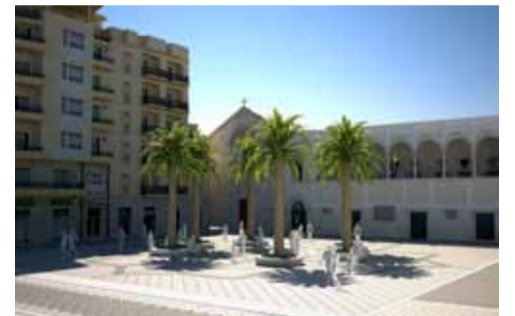
Piazza del Popolo oggi

e non la socialità) o nella peggiore delle ipotesi, spazi pubblici concessi in comodato d'uso ai privati. E sì, perché la sensazione che si ha, e spesso non è solo una sensazione, è che queste piazze stiano perdendo il loro valore e senso pubblico in favore di locali che non sempre legittimamente ne occupano il suolo. Basta fare un giro nelle calde sere d'estate per verificare un'espansione selvaggia di tavolini e arredi dei locali circostanti. Con questo non si vuole demonizzare i "dehors" che, specie in una località marittima e turistica come Manfredonia, favoriscono e contribuiscono al refrigerio dei cittadini e dei turisti; quello che si condanna invece è l'espansione incontrollata, elemento di disturbo per chi rispetta le regole e di intralcio per la godibilità pubblica di piazze, vie e strade. Sarebbe, però, auspicabile una giusta regolamentazione per l'occupazione di tali spazi affinché non sia d'intralcio a chi passeggia e al contempo dia la possibilità agli esercizi di svolgere la loro attività.