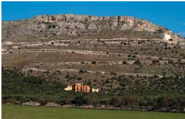
Villa Rosa e la montagna che la sovrasta