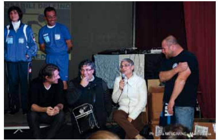
Un momento della cerimonia

partecipazione che coniuga in un unico agorà tematiche di antirazzismo, aggregazione, solidarietà e controinformazione. Obiettivo riuscito, questo lo si può ben affermare, perché il 9 dicembre scorso presso il LUC abbiamo assistito ad una cerimonia altamente significativa, in cui i valori di amicizia, fratellanza e soprattutto rispetto per chi vive situazioni di disagio, sono stati denominatore comune in una folla plaudente di tifosi biancocelesti che, questa volta, non hanno intonato cori in favore della loro squadra del cuore, il Manfredonia, pur presente con l'intera rosa. Questa volta i cori e gli applausi di incoraggiamento, mentre venivano consegnate le divise sportive, erano tutti rivolti agli atleti diversamente abili della Delfino, a questi incredibili e fantastici ragazzi che dal lontano 1989 praticano sport a livello agonistico mietendo in tutta Italia e nel mondo successi e vittorie di valore incommensurabile. Vittorie che nascono dalla volontà di esserci, dalla necessità di confrontarsi, dall'orgoglio di chi afferma con la propria presenza che lo sport è un diritto di tutti, anche di chi non ha un corpo bello ed elegante da mostrare ma un cuore immenso e grande da donare.