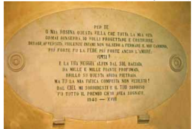
Epigrafe (oggi scomparsa) collocata all'ingresso della villa, ripulita dalle scritte dei vandali che hanno contribuito alla decadenza di Villa Rosa

Mariantonietta Di Sabato