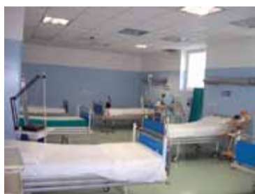
Interno del Pronto soccorso

Con vivo piacere e plauso, si condivide questa importantissima iniziativa del Primario del nostro Pronto Soccorso e la Redazione di ManfredoniaNews.it nel dare alla stampa questo opuscolo che fa vivere