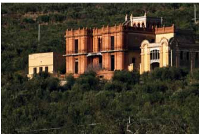
Facciata sud di Villa Rosa

competenti. Questo è uno dei tanti progetti presentati per la rivalutazione di Villa Rosa, ma chissà perché finora nessuno sembra aver trovato il favore degli enti preposti. Visto che la nostra costa è ormai fin troppo martoriata, e prima che un edificio di tal pregio crolli definitivamente, ci auguriamo la pronta approvazione e attuazione di un progetto che valorizzi e protegga dalla cementificazione la montagna che ci guarda dall'alto.