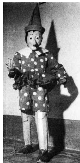
Pinocchio, Veglioncino 1955