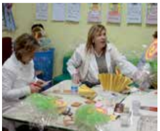
Maestre al lavoro

stato raccontato dai protagonisti del carnevale fra cui una maestra di una scuola elementare che ci ha dichiarato: "Sono quasi dieci anni che partecipo attivamente alla realizzazione dei gruppi per la Sfilata delle Meraviglie, e vi devo confessare che oramai non riesco più a farne a meno, amo questo clima di allegria, amo il nostro Carnevale, amo la nostra città invasa da questa festa frenetica, una festa che sicuramente è molto impegnativa, ma questo impegno e questa fatica è sicuramente retribuita nel momento dell'entrata in scena, quando hai davanti ai tuoi occhi, tutte quelle piccole meraviglie, che in un certo senso sono anche creazioni nate dalle nostre passioni e sicuramente dal nostro lavoro. Credo che continuerò a dedicarmi al carnevale perché forse senza carnevale saremmo meno felici, felicità che riappare con l'arrivo del carnevale, che scardina tutto facendoci dimenticare la nostra vita quotidiana, sempre invasa da problemi