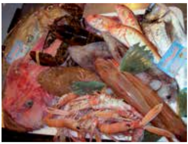
Zuppa di pesce del golfo di Manfredonia