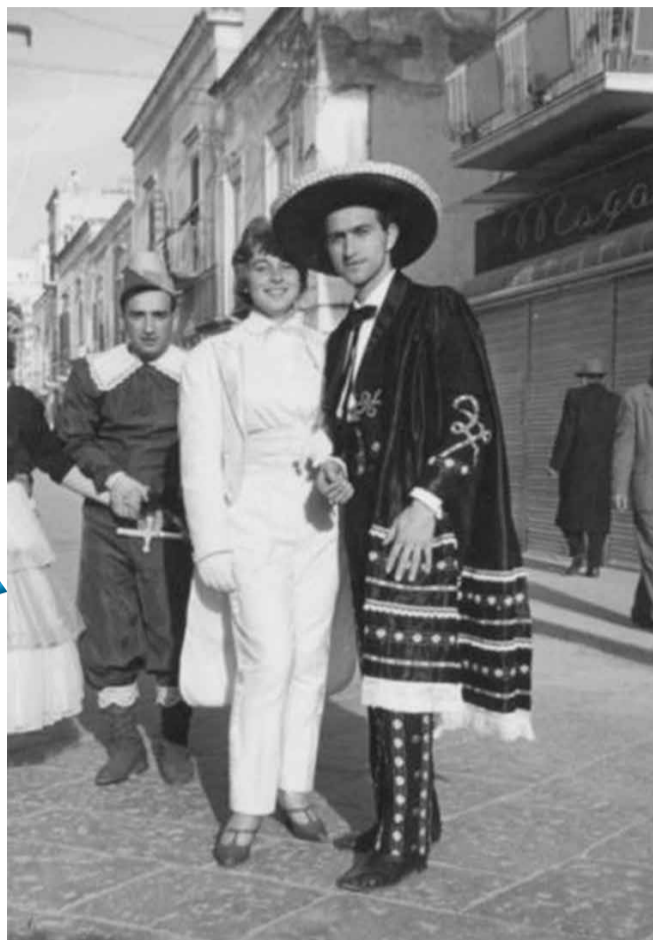
Carnevale 1959