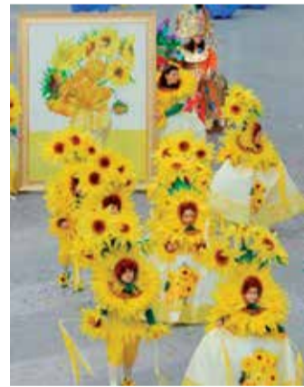
Quadri d'Autore anno 2008