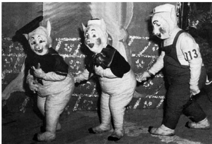
I tre porcellini, Veglioncino 1953