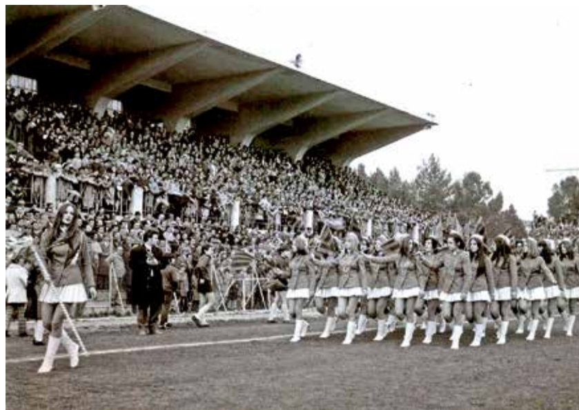
Le Perle del Golfo allo Stadio Zaccheria di Foggia 1971

ardente ma qualcosa nella sua organizzazione è da perfezionare. "Effettivamente, si vede arrivare una massa di ragazzi in modo confuso, disordinato, con musica sparata a mille, esibizioni tutte uguali e non sempre si percepisce grande fantasia nelle realizzazioni artistiche. Nella foto indosso un vestito arabo da me comprato a Gerusalemme, veramente notevole per qualità. Ecco cosa manca nel Carnevale di Manfredonia, le maschere. La gente viene qui per vedere gli altri in maschera e non ritiene importante mascherarsi, quasi non si sente coinvolto. Il compito di chi organizza questo evento dovrebbe essere soprattutto quello di coinvolgere la gente, cosa che invece fanno in altre città. Ho sentito che spesso dopo le sfilate i giovani distruggono i propri vestiti, veramente uno spreco enorme, se poi parlia-