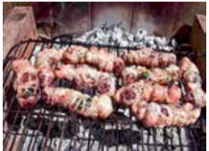
Torcinelli alla brace