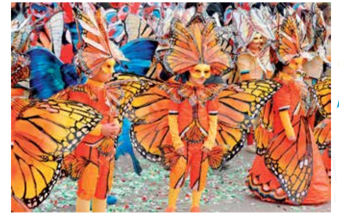
Il volo delle farfalle anno 2012