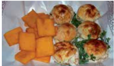
Farrate e scagghjuzze