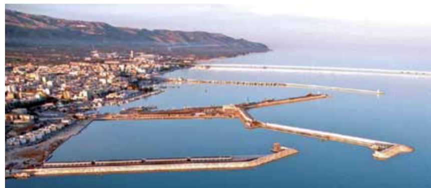
Il nascente Porto Turistico di Manfredonia