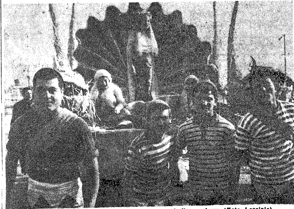
«La Pesca meravigliosa» 1. premio gruppi di maschere