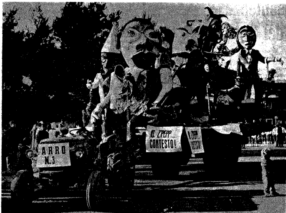
Anche il « Zi' Peppè » contesta. Questo il tema del carro allegorico a cui è andato il 1° premio.