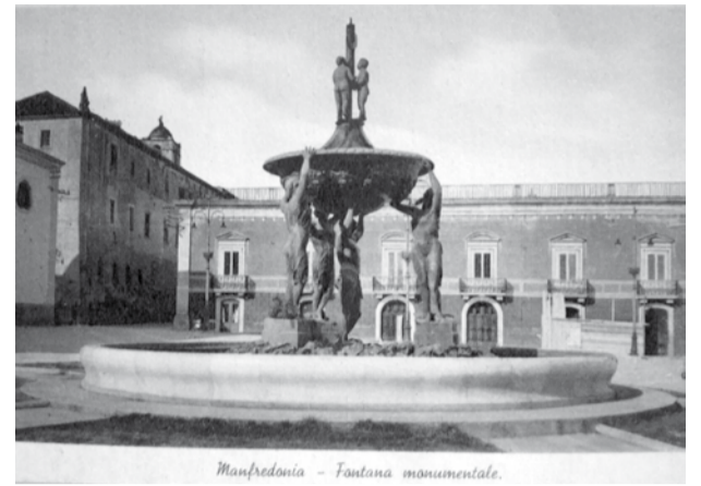
Manfredonia - Fontana monumentale.

In questi giorni si sente parlare spesso del reato di apologia del fascismo e dell'inasprimento delle pene non solo per chi fa il saluto fascista o possiede in casa immagini del duce e del ventennio ma anche di chi ne "richiama pubblicamente la simbologia...". Non vogliamo entrare nel delicato dibattito sulla limitazione all'espressione d'idee e opinioni, quanto trattare di qualcosa di facilmente osservabile