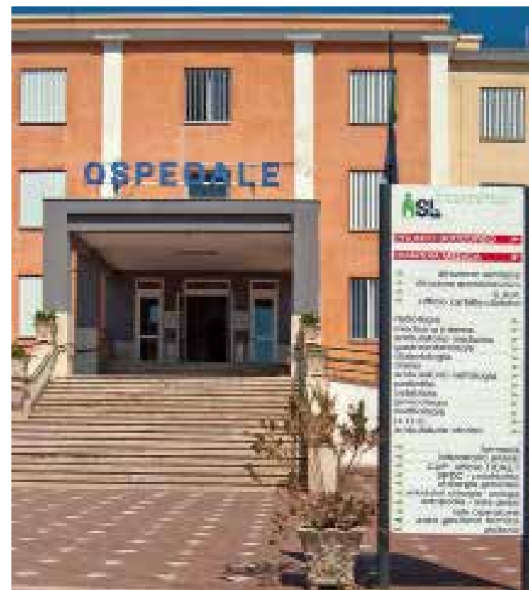
L'ospedale San Camillo De Lellis di Manfredonia

posti letto, dei reparti e chiusura di alcuni Ospedali. Nel nostro territorio le strutture assistenziali alternative sopra indicate non sono sufficienti e quindi la programmata territorializzazione della sanità, oggi purtroppo ancora inadeguata, ci penalizza gravemente e rischia di diventare perdita secca del diritto alla salute. La programmazione regionale prevede nello specifico la riduzione di 257 posti letto in Capitanata (di cui 30 unità nell'Ospedale di Manfredonia), la disattivazione degli Ospedali con meno di 70 posti letto con loro parziale riutilizzo in strutture sanitarie territoriali ed infine l'accorpamento o la disattivazione di Unità operative ospedaliere sulle basi di gravi carenze dell'organico, del tasso medio triennale dell'occupazione dei posti letto e dell'inappropriatezza delle prestazioni. Tutto questo ha avuto, sta avendo e potrà avere conseguenze molto gravi per la situazione sanitaria del nostro territorio, privando di una adeguata copertura sanitaria i cittadini fino al punto di far saltare i livelli essenziali di assistenza (LEA).