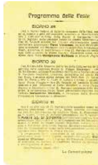
Programma della festa patronale del 1919

ManfredoniaNews.it è distribuito in oltre 200 attività commerciali della città Sostieni l'informazione libera della tua città BANCO POSTA intestato a: Associazione Culturale MANFREDONIANEWS.IT - C/C n. 8328062 IBAN: IT09 X076 0115 7000 0000 8328 062