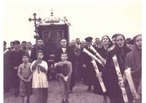
Anni '50, L'icona della Madonna viene portata in processione dalla Basilica di Siponto in Cattedrale

occasione dei festeggiamenti in onore della Vergine di Siponto, risulta che, l'Intendenza di Capitanata, in data 27 settembre 1849 autorizzava il sindaco di Manfredonia a far esibire la banda musicale, "la corsa de' palli, lo sparo dei fuochi artificiali e l'innalzamento dei globi aerostatici". Successivamente, tale solennità fu fissata definitivamente il giorno 30 di agosto. Solennità che viene celebrata ancora oggi in questa data, sin dall'epoca dell'arcivescovo Vincenzo Tagliatela (1854 - 1879). La festa ha inizio il 29 di agosto e termina il 31 con la solenne processione. Prima del definitivo trasferimento in cattedrale la Sacra Immagine il 22 agosto veniva portata in processione dalla Basilica di Siponto per la tradizionale Novena. Dopo la solenne processione, sempre tra una folla di popolo orante, preceduto dall'arcivescovo e dal clero e dalle Autorità civili e militari, la stessa veniva riportata a Siponto. Interessante annotare che, fino al 1968 in processione venivano portati oltre al simulacro della Madonna di Siponto i santi Patroni, S. Lorenzo Majorano, S. Filippo e S. Michele Arcangelo. Oggi sono in tanti ad auspicare il ripristino della vecchia tradizione.