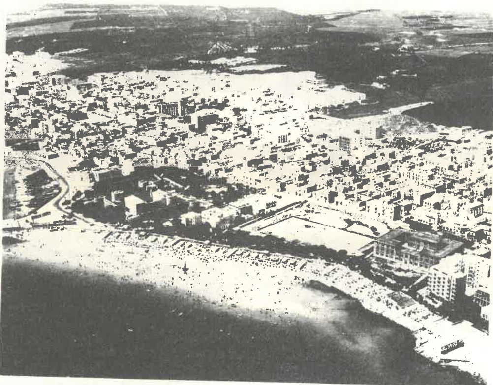
Veduta aerea di Manfredonia.