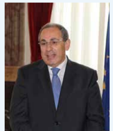
Il Prefetto Michele Di Bari

Il Prefetto Michele di Bari è stato collocato a disposizione ai sensi della legge 30 dicembre 1991, n. 410, con incarico di dirigere la struttura di missione di cui all'art. 30, comma 1, del decreto legge n.189/2016 convertito in legge n.229/2016 recante "Interventi urgenti in favore delle popolazioni colpite dagli eventi sismici del 2016". Il provvedimento assunto dal Consiglio dei Ministri riveste un particolare profilo istituzionale che, se da un lato conferma la professionalità maturata negli anni dal dottor di Bari ai vertici di prefetture e di strutture operative complesse ministeriali, dall'altro certifica un impegno segnato da uno spiccato senso istituzionale consegnato ad un responsabile spirito di servizio. Nato a Mattinata, città di cui è stato anche sindaco per tre anni, Michele di Bari, 62 anni, ha conseguito negli anni una considerevole esperienza tecnica sia in ambito giuridico, sia in ambito amministrativo, attività accompagnata da studi sulle politiche pubbliche perfezionati negli anni